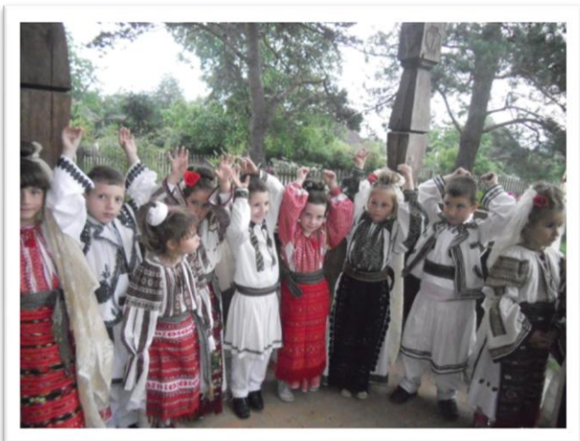
Vizită la Muzeul Satului din Râmnicu Vâlcea